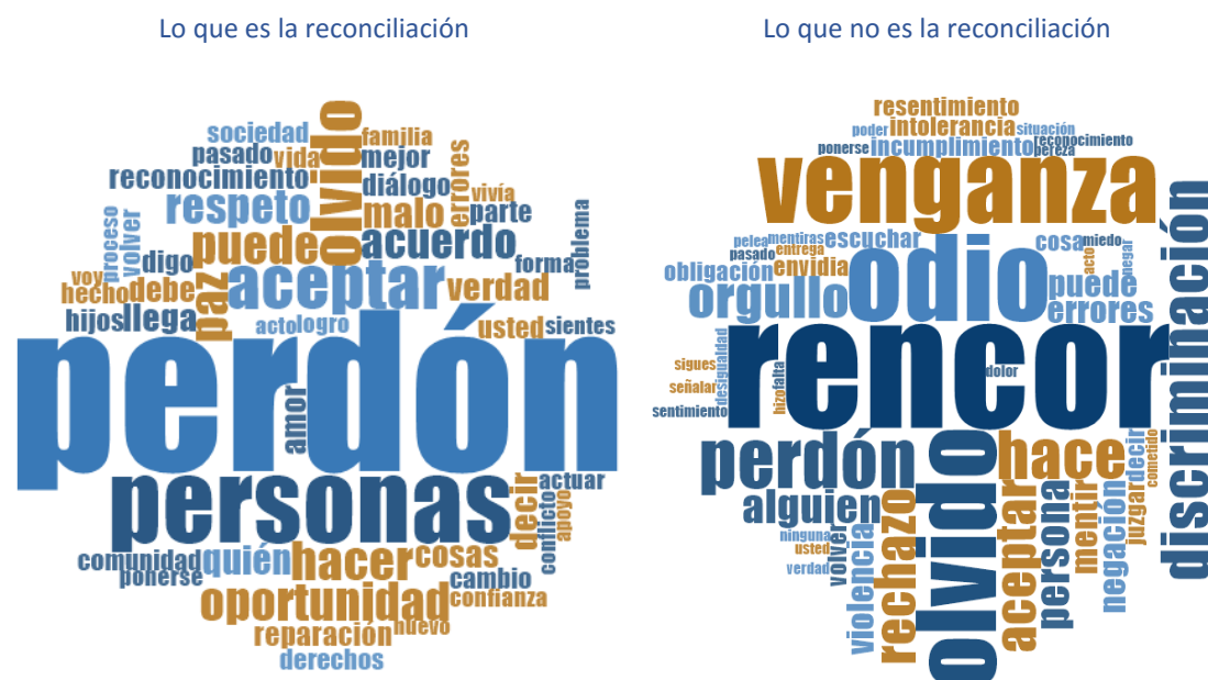
Figura 1. Nube de palabras de definiciones de la reconciliación